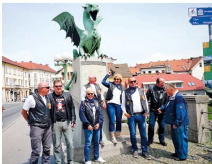
Postanek pri zmaju na Zmajskem mostu.

Lanski MOJ DAN MLADOSTI pa smo zabeležili tudi s spominsko osebno znamko pošte Slovenija, sliko je