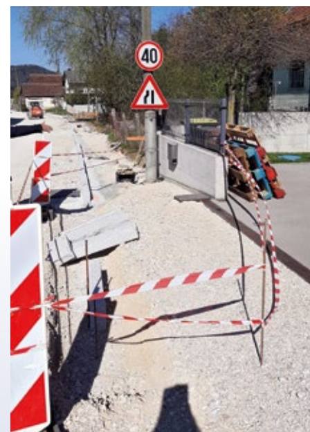
Dela v Utiku so v zaključni fazi