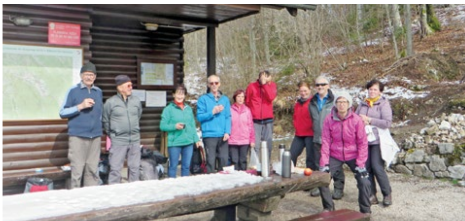
Pred planinsko koč na Mali gori pri sv. Ani

Jutranji zbor je bil, kot vedno, na parkirišču pred pokopališčem v Vodica. S tremi avtomobili smo se po avtocesti odpeljali v smeri Primorske. Pri Črnemu Kalu smo zavili na staro cesto in sledili smerokazom za Hrastovlje oziroma Dol pri Hrastovljah. Na koncu vasi z znamenito cerkvico z mrtvaškim plesom smo našli lepo urejeno parkirišče, kjer smo pustili vozila in začeli vzpon proti Lačni. S parkirišča vodi cesta mimo njiv in vinogradov proti hribovitemu grebenu,