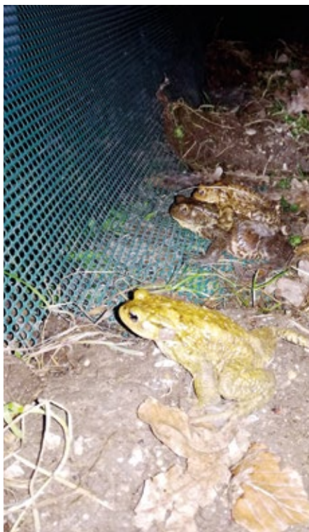
Ograja zadrži krastače

Evropski kmetijski sklad za razvoj podeželja: Evropa investira v podeželje