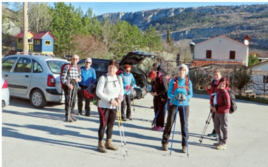
Pohodniki na izhodišču za pohod na Lačno v Hrastovljah

V začetku marca smo še ujeli lepo vreme in prehiteli omejitve zaradi okužb ter se odpravili v smeri Dolenjske. Za izhodišče smo izbrali Podtabor v Struški dolini, kamor smo prispeli po avtocesti do Grosupljega in od tam v Dobropoljsko dolino. V vasi ni urejenega parkirišča, pa vendar smo našli primerno mesto in dovoljenje za parkiranje pri domačinih, ki so nas tudi pravilno usmerili na pot proti vrhu hriba, na katerem so Stene sv. Ane. Pot vodi strmo skozi gozd in preči nekaj gozdnih cest, nato zavije proti zahodu in se pred vrhom razdeli v levo smer, ki vodi do kočice na Mali gori, in desno proti vrhu. Po nekaj več kot uri hoje smo se znašli na vrhu Sten sv. Ane, na katerem je kamnita geodetska piramida. Okolica piramide je