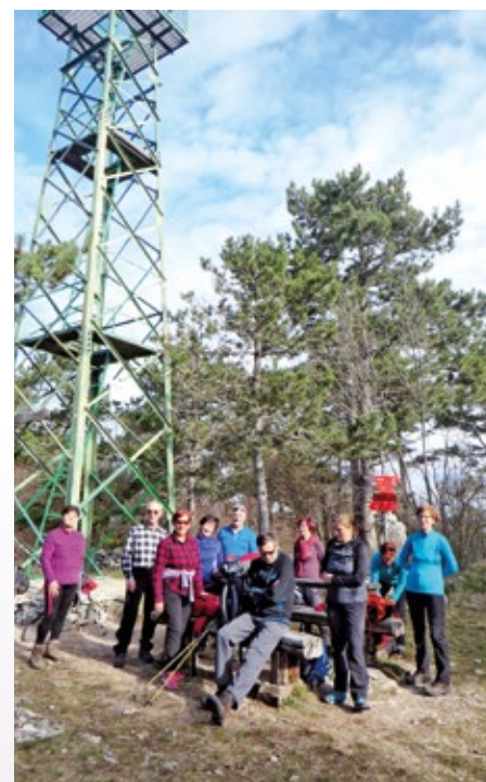
Na vrhu Lačne pod razglednim stolpom

Preživeti prijeten dan v dobri družbi je vedno dobrodošlo, zato upam, da bomo kmalu spet obuli pohodniške čevlje, si oprtali nahrbtnike in se podali novim dogodivščinam naproti. Ko bo spet kaj novega, se znova oglasim s prispevkom v našem glasilu, do takrat vsi skupaj upoštevajmo navodila za umiritev pandemije in ostani mo zdravi.